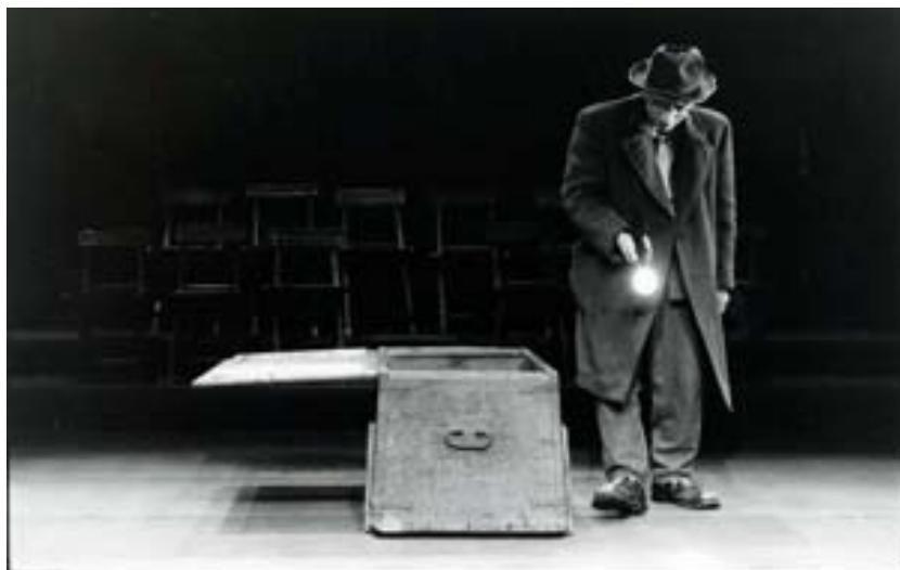
Jozef van den Berg in Genoeg Gewacht (1988-1989).

gebeurde er daarna, aan het slot van de voorstelling op 12 september, nog iets heel opmerkelijks. De kist gaat zonder tekst erin weer dicht. De Jongeman komt op zijn stoel naar beneden. Hij pakt de tekst die naast de kist ligt en legt deze op de kist. Dan trekt hij toch! de mooie kleren van Godot aan en loopt naar de gordijnen. Die zouden dan opengaan en dan zou hij het licht inlopen. Dát was mijn bedoeling. En ik sta voor die gordijnen en... ze gaan niet open! Ze gaan gewoon niet open! Niemand begreep later waarom niet, maar ze gingen gewoon niet open.